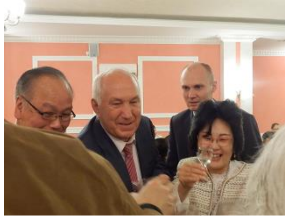
ソコロフ市長と乾杯