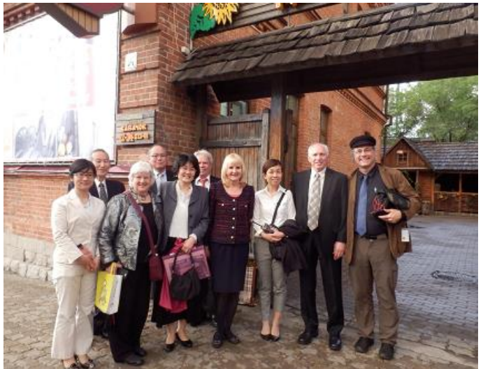
友好都市のポートランド市の方々と交流