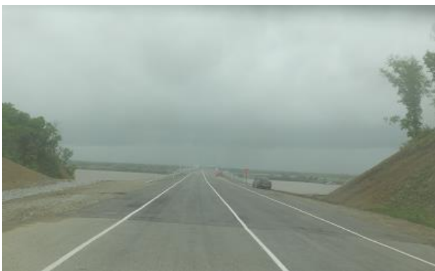
プーチン氏が「はんぶんこ」した中国国境との中洲に向かった。