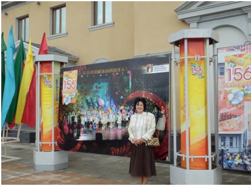
5/30 ハバロフスク市制 156 周年レセプションに参加