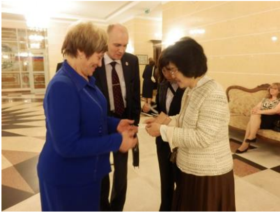
協会設立当初からお世話になっている シェフチェンコ副市長と名刺交換