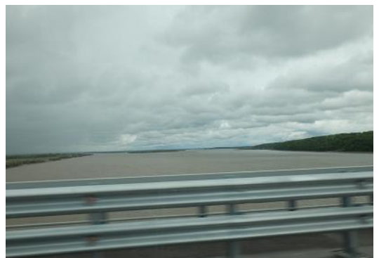
ガードレールの右がロシアで、左が中国の新大橋を未許可で渡り、途中でUターンしてきた。