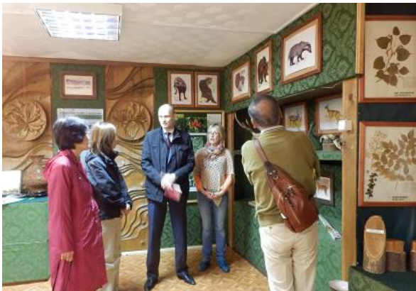
大ヘフィツィル自然保護区 博物館見学