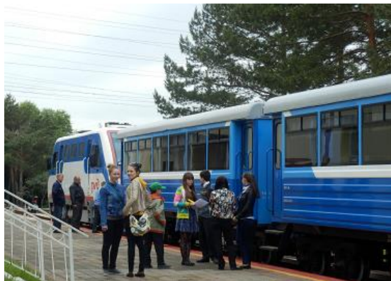
到着夜の晩餐 市役所通訳さんが 2 名とは頼もしい 子ども鉄道 8~15 才が運転手・車掌等を務める