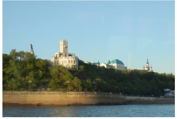
午後 9 時から船上パーティーが始まるが、まだ外は明るい。