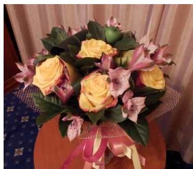
5/27 パレスホテル到着 空港にて花束をいただく。