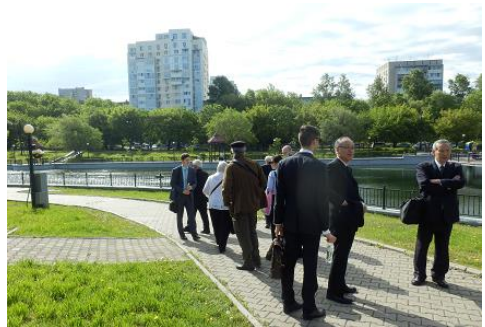
みちのく銀行が寄付した池のある公園