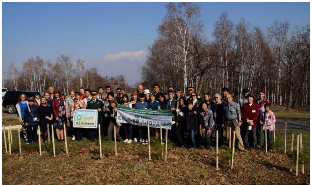
アムールスク市において多くの市民と記念植樹(チョウセンゴヨウ)

日 程：2020年4月28日(火)～5月6日(水) 募集人員：15名(協会会員および初参加者優先) 募集締切：2020年1月6日(月) 費 用：23万円(予価) (食事付き、ビザ手数料など別途費用あり、学割あり要相談)