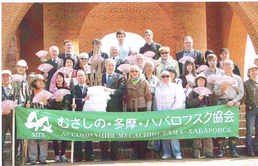
2012年ハバロフスク平和慰霊公園におけるサクラの記念植樹 (中央で苗木を抱えているのがイワンチェンコ学長)

植林事業や大学生交流事業でお世話になっている太平洋国立大学のセルゲイ・N・イワンチェンコ学長におかれましては、令和2（2020）年秋の外国人叙勲で旭日中綬章を受章されました。功労概要は「日本・ロシア間の学术交流及び相互理解の促進に寄与」とあります。当協会の活動にも理解を示されて、多大なるご協力を頂きましたので、心からのお祝いを申し上げます。